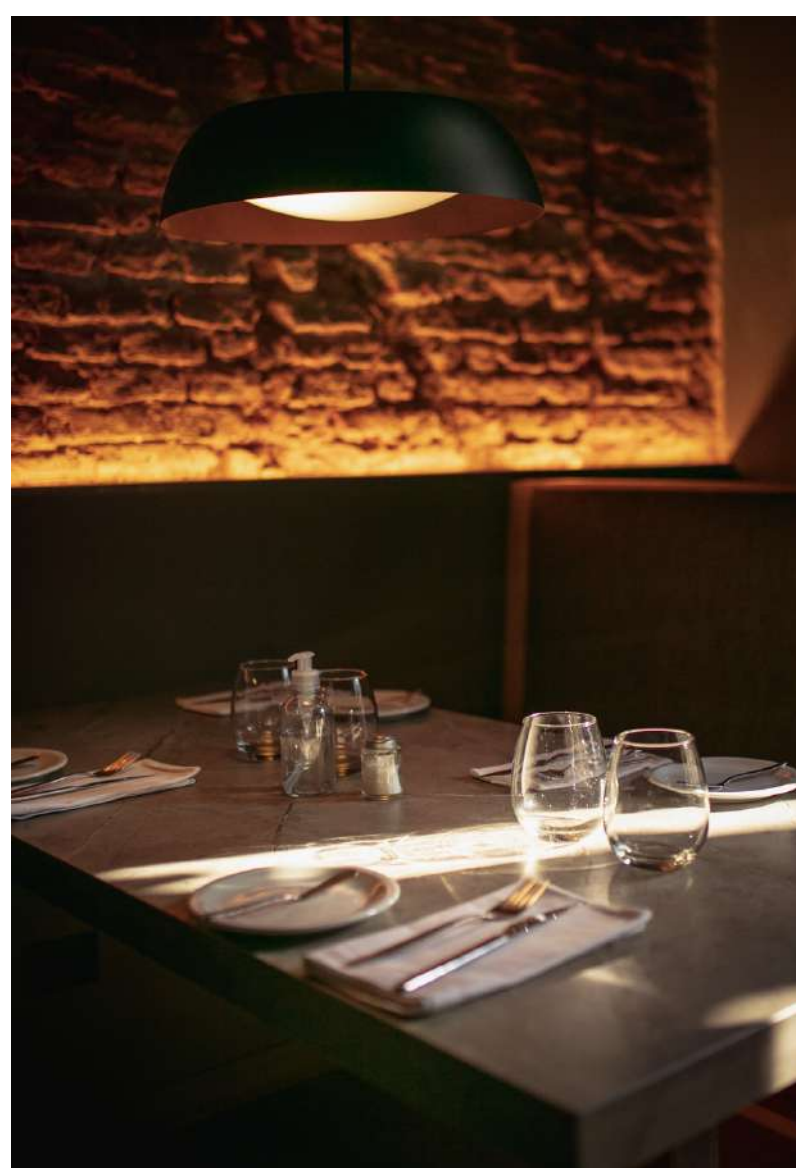
07. Mesa salón