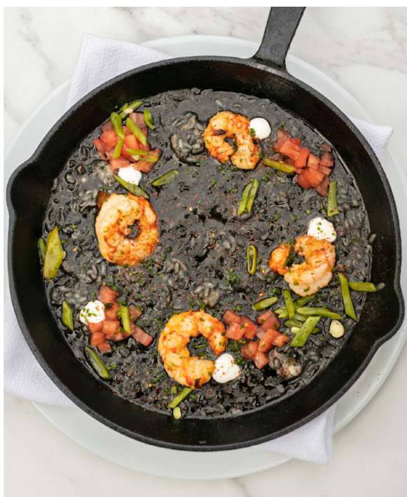
01. Arroz negro

Nuestro objetivo es llevar la comodidad y familiaridad de los sabores del hogar a nuevas alturas, ofreciendo a nuestros comensales una experiencia gastronómica que combina lo mejor de ambos mundos: la calidez de lo conocido y la emoción de la alta cocina.