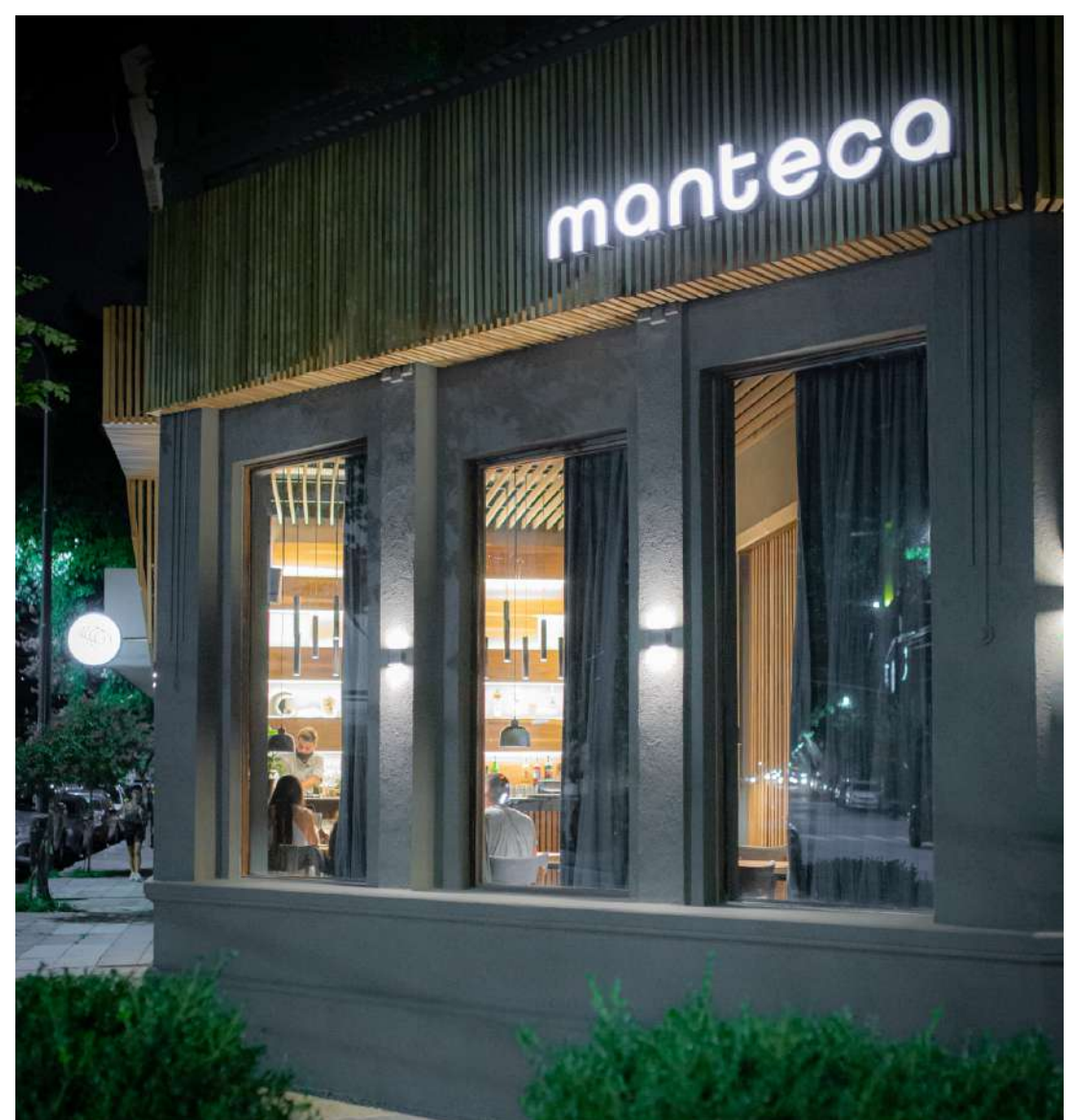
11. Exterior Local