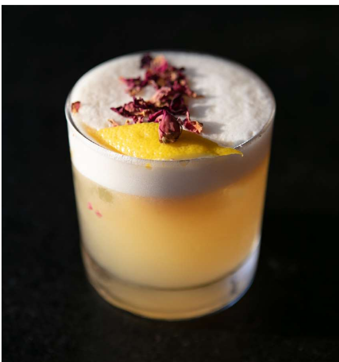
10. Nombre trago