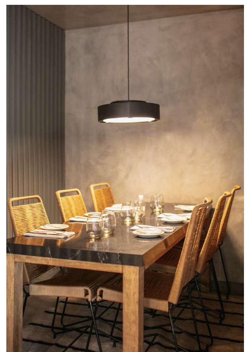
09. Box privado