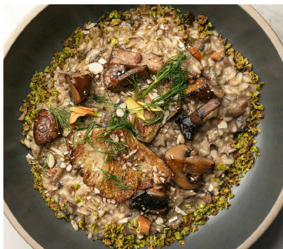
05. Risotto de Hongos