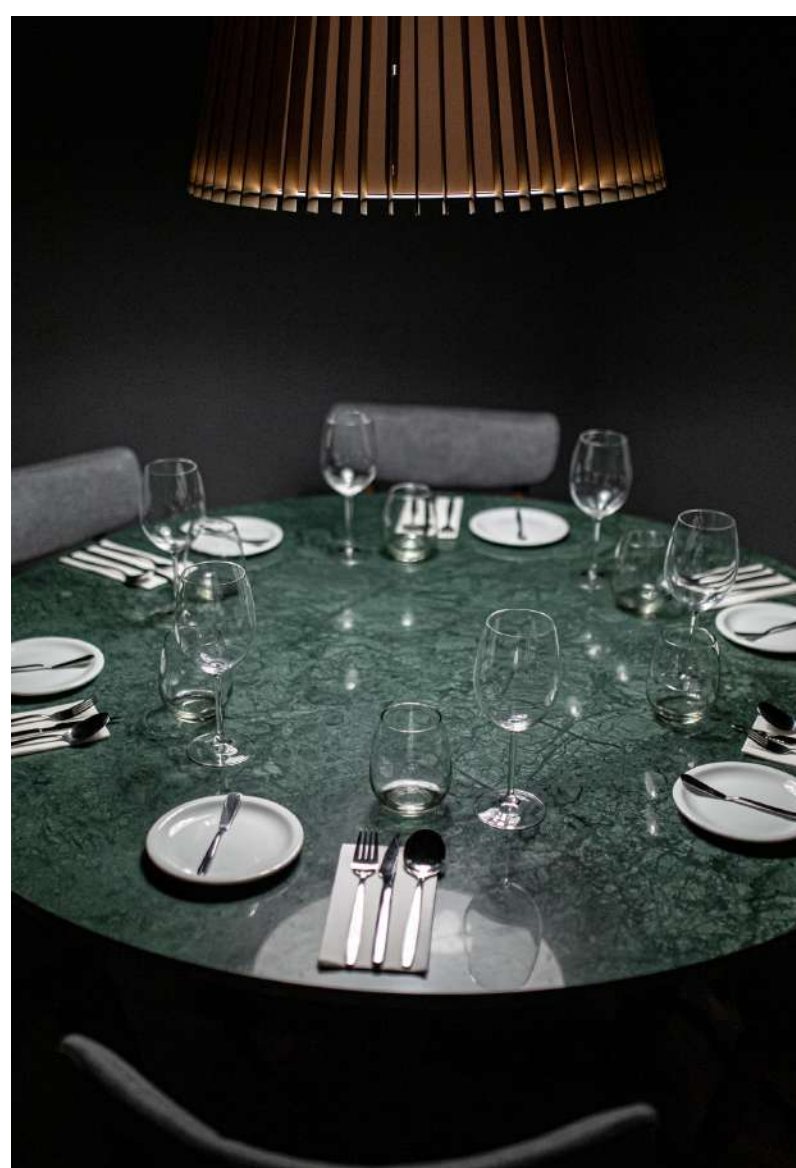
08. Mesa entepiso