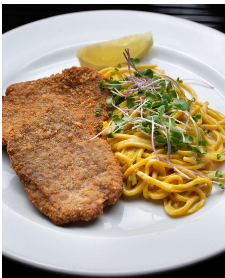
02. Milanesas con fideos