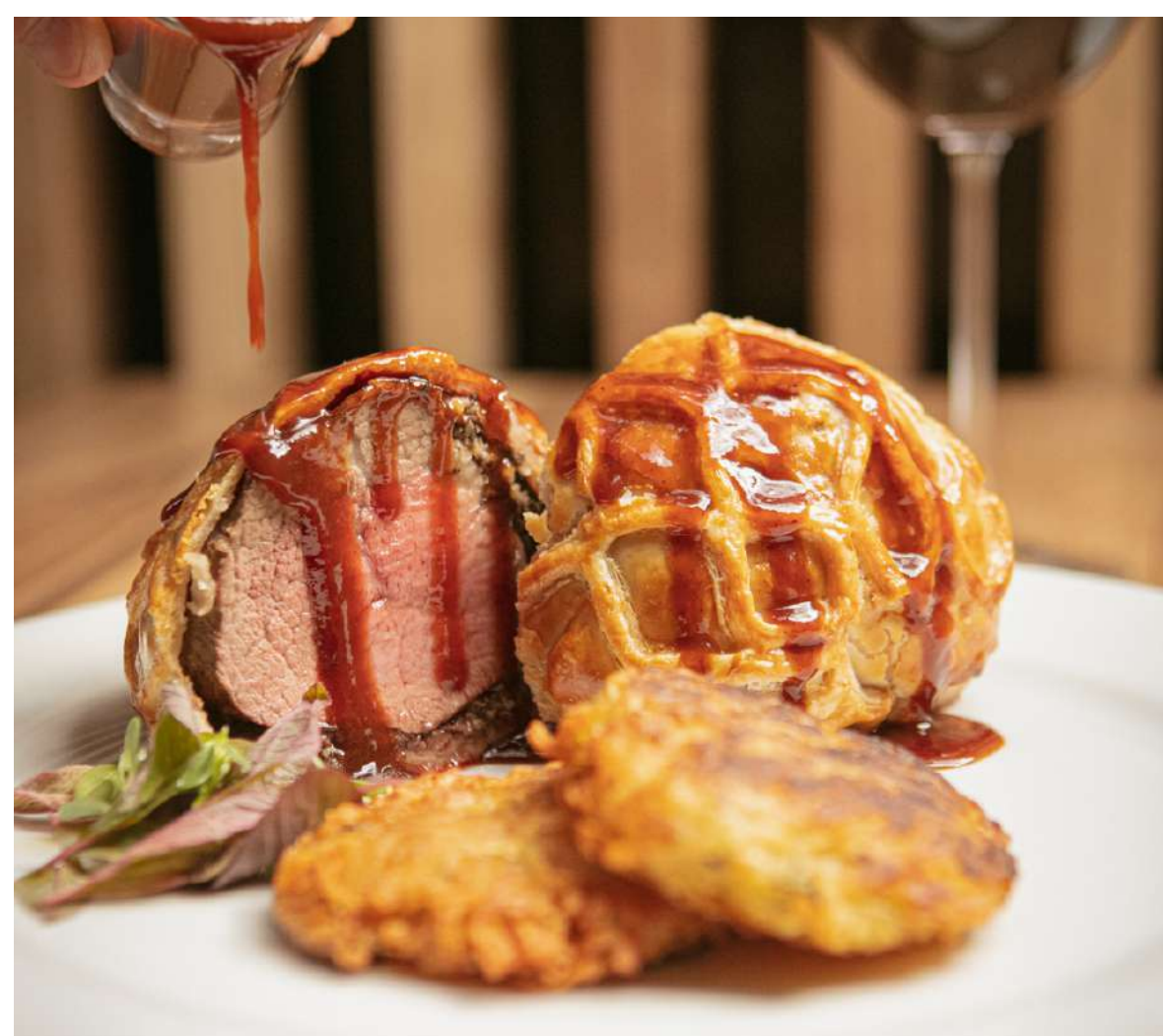
04. Beef Wellington

Creemos en una cadena alimentaria más corta y transparente, donde los alimentos se cultivan y se cosechan con cuidado y respeto por el medio ambiente, y donde los agricultores y pescadores locales son valorados y apoyados en su labor.